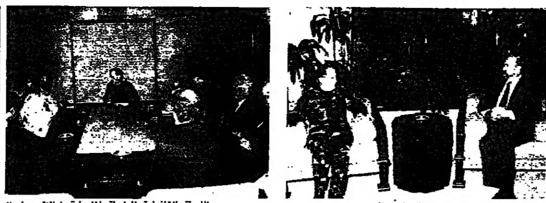
الجنة التنفيذية للرابطة المرونية (اليمين)